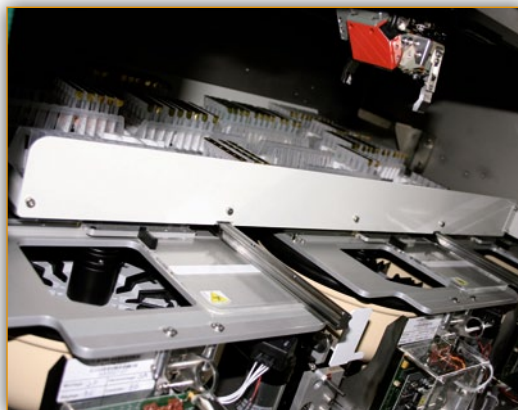
3 встроенные центрифуги

Элементы системы при необходимости компенсируют работу друг друга.