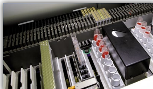
Непрерывная дозагрузка реагентов и образцов