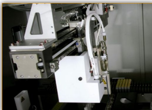
2 независимые дозирующие иглы, независимый транспортный модуль

Система ИН-1000 обладает высокой гибкостью и принципиально новой логикой автоматизации, ориентированной на скорейшее получение полного результата исследования по каждому образцу.