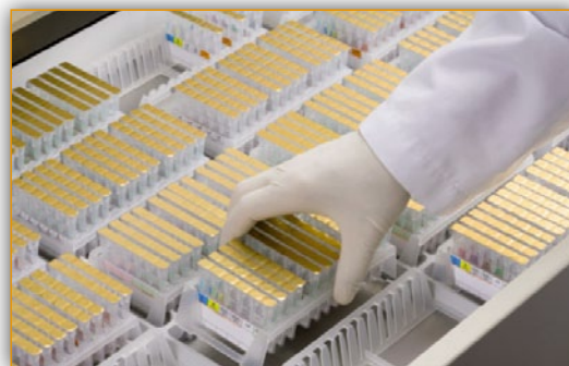
Зона хранения вместимостью до 240 ID-карт