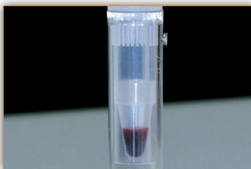
Специальные адаптеры для педиатрических образцов