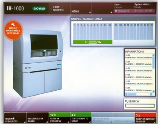
Интуитивно понятный сенсорный интерфейс