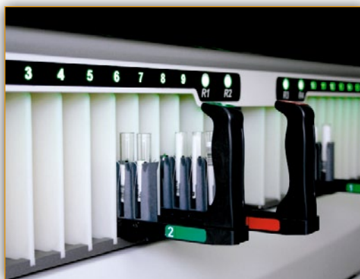
Возможность одновременной загрузки до 180 образцов и 28 реагентов